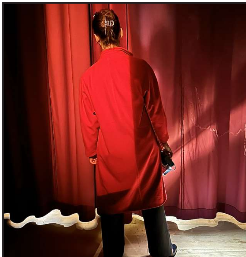
CONTRESENS , Théâtre Stormen, Trollhättan, Suède, novembre 2024.