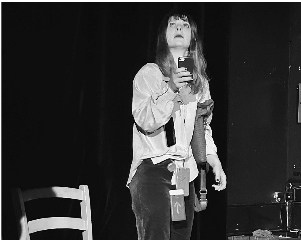
CONTRESENS , IVT (International Visual Theatre), Paris, juillet 2024.

Une pièce qui invite les spectateurs à devenir les observateurs de leur propre vie, à reconsidérer les codes et normes sociales, et à envisager la possibilité de morts et de renaissances « symboliques », au sein d'une même existence.